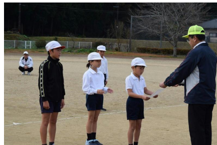
新記録、おめでとうございます！