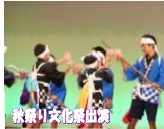
秋祭り文化祭出演