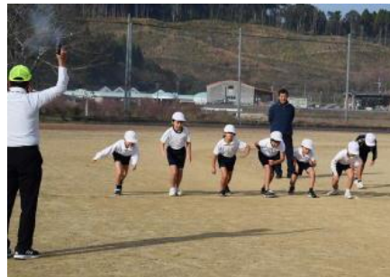
持久走大会3・4年スタート

子供達の成長につながる素晴らしい行事を行うことができたのは、保護者の皆様の御協力や地域の皆様の御支援をいただけたからこそだと考えています。本当にありがとうございました。