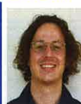
ALT デオート・マツン・ジョン・リスリー

Hello. Feel free to ask me any questions about English countries. Let's have fun in English together.