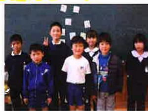
(写真撮影のためマスクを外していません)